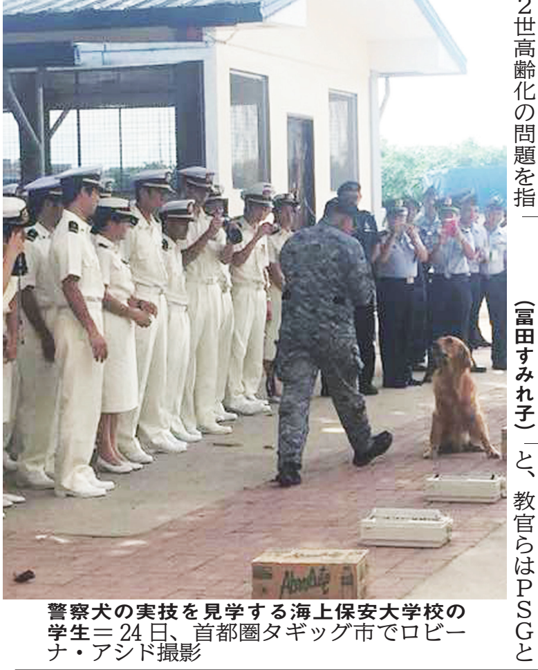
警察犬の実技を見学する海上保安大学の学生=24日、首都圏タギグ市で

国家警察アンヘレス署(43)を未成年買春容疑はこのほど、日本人男性で逮捕した。同署によると、21日午後4時ごろ、少女2人がルソン地方バランガ州アンヘレス市内で交通整理員に助けを求めた。整理員が周囲を捜すと、逃走する男性を買春した疑いが持たれた。