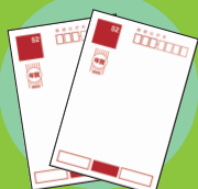
未投函ハガキ・年賀状 ※ポストカード不可