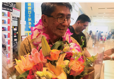
親族対面のための一時帰国

フィリピン残留日本人 2 世の親探し・日本国籍回復支援・日本の親族との対面事業ならびにフィリピン日系人社会の発展のための事業に使わせていただきます。