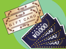
図書券・テレカ・金券 ※有効期限が3ks月以上のもの