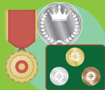
勲章・金貨 貨幣セット