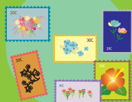
国内外・未使用切手 ※そのままお送りください