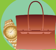
ブランド品・時計