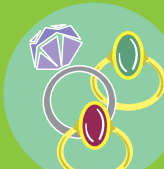
ダイヤモンド・宝石