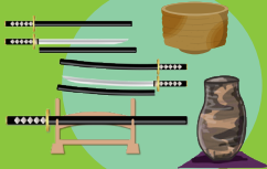
骨董品 刀剣・刀装具