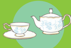
ブランド食器 ※マイセン/ウェッジウッド/ハカラ等