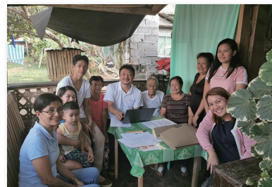
現地での面接調査